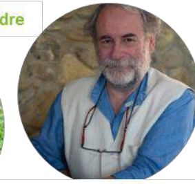
Azienda Agricola Mannucci Droandi