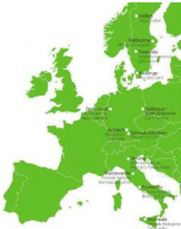
Karta 1. SOLMACC:s 12 demonstrationsgårdar.

12 motiverade ekologiska bönder i Tyskland, Italien och Sverige, med fyra gårdar i vart och ett av de tre länderna (se karta 1), blev SOLMACCs demonstrationsgårdar för att i praktiken pröva klimatvänliga och resilienta odlingsmetoder. Bönderna bidrog med mark, utrustning och arbetskraft och delade sedan med sig av sina erfarenheter.