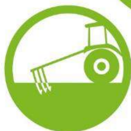
OPTIMISED TILLAGE SYSTEM