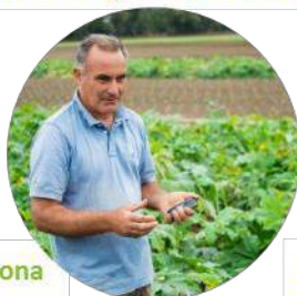
Azienda Agricola Caramadre