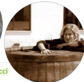
Azienda Agricole Tamburello