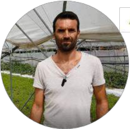
Azienda Agricola Fontanabona